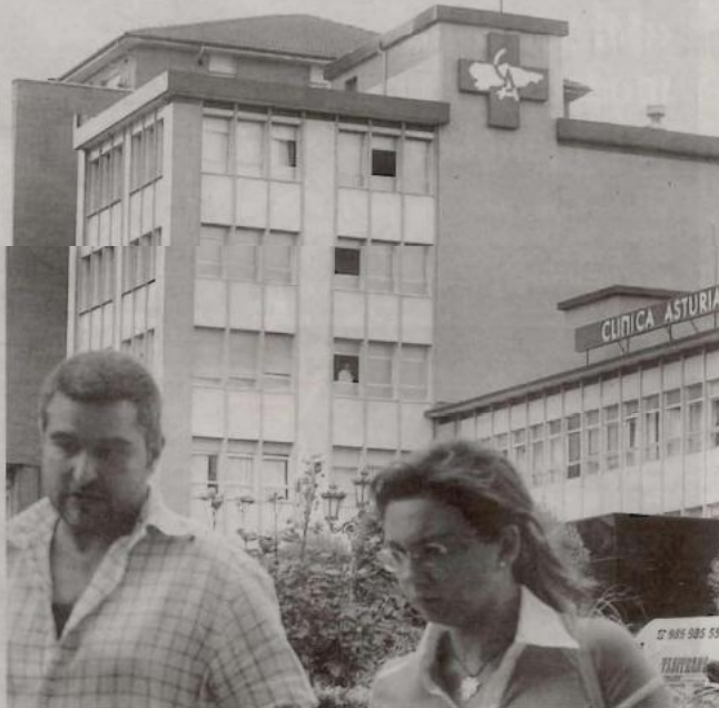
2.000 METROS. Es la dimensión de la actual clínica en la falda del Naranco. / MARIO ROJAS

Dois años es el plazo de ejecución previsto para la clínica, que en la actualidad aglutina «más de 90 profesionales entre personal médico, enfermería, administración y personal de servicios generales. Además cuenta con más de 60 facultativos de distintas especialidades que componen su «cuadro médico», según explica su página web. El grupo hospitalario propietario de la clínica no sólo crece en Oviedo. También ha ampliado sus instalaciones en la Clínica del Pilar de Zaragoza con la inauguración de una unidad de maternidad y otra de reanimación posanestésica, que integran un plan de renovación que supondrá un desembolso de 4,5 millones.